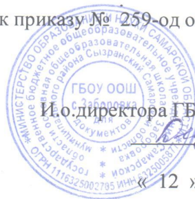
ГРАФИК ПИТАНИЯ ОБУЧАЮЩИХСЯ