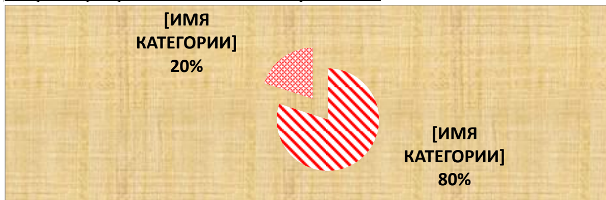
Диаграмма распределения педагогов по образованию: